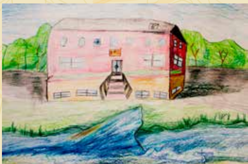
Edgars Škirpa "Lielupes vilnis pie Mākslas skolas" (Atzinība)