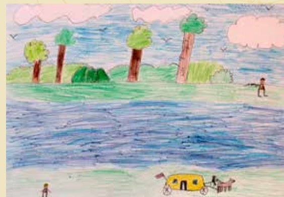
Justs Ostelis "Senā Lielupe" (Atzinība)