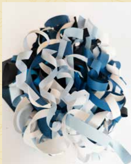
Anastasija Skvorceviča "Vetrā" (I pakāpes diploms)