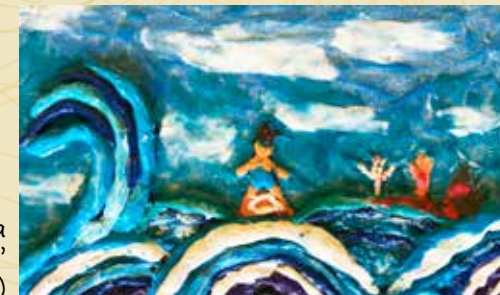
Sofija Ivanova "Uz viļņa" (Atzinība)