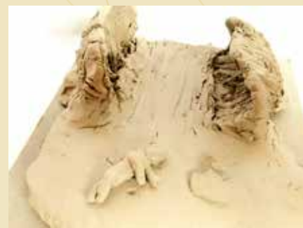
Ralfs Bitēns "Starp diviem" (Atzinība)