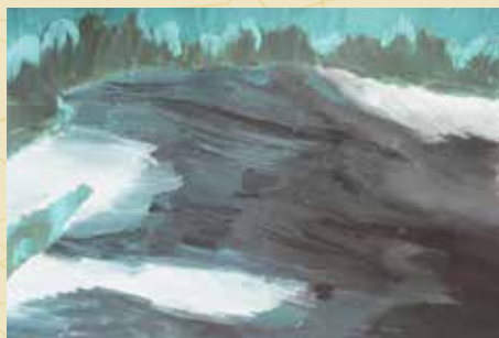
Ruslans Vilmanis "Atspoguļotā nakts" (I pakāpes diploms)