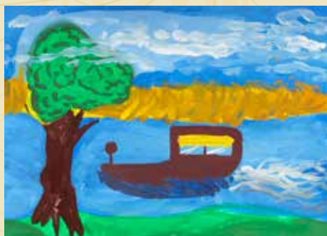
Yana Poltashevskā "Lielupe" (Atzinība)