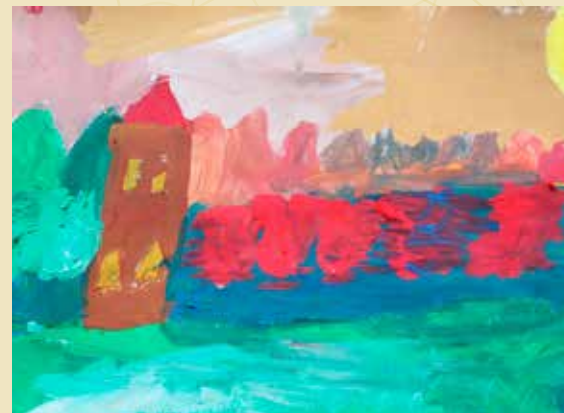
Arina Šelovskija "Lielupe pie Teteles" (I pakāpes diploms)