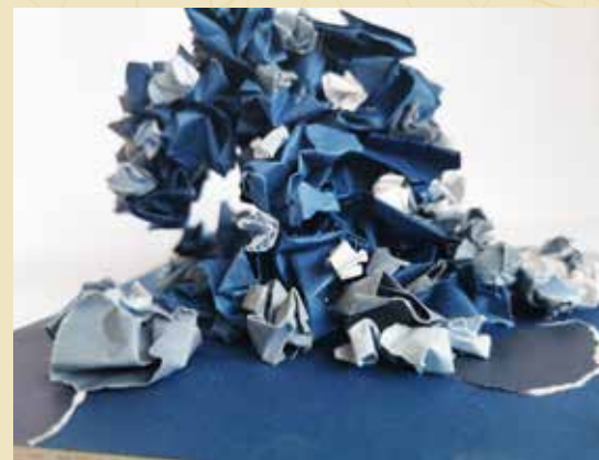
Rasa Šmidre "Tumši zilā plūsma" (I pakāpes diploms)